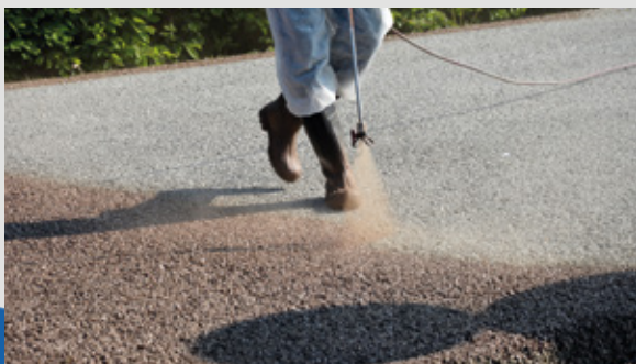
Colorazione con soluzione mineralizzante