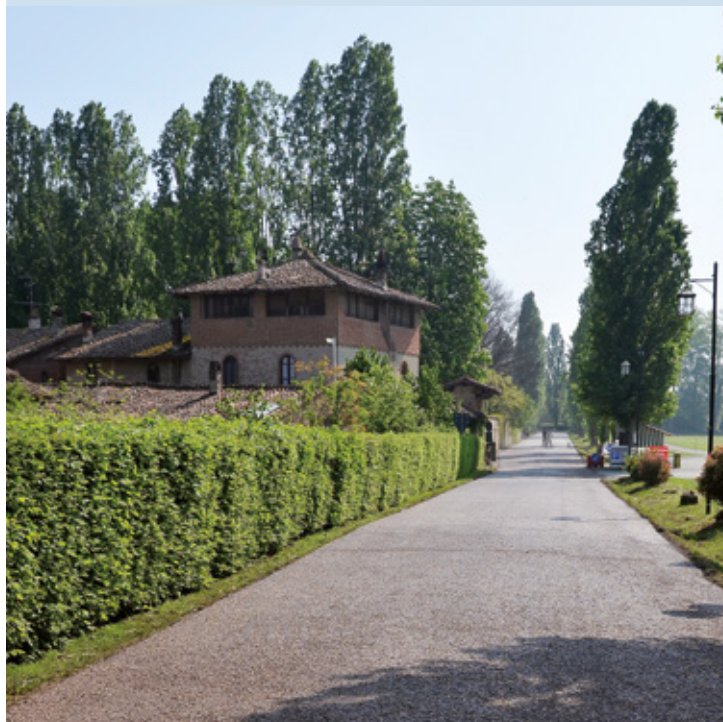
VIA D'ACCESSO AL BORGO