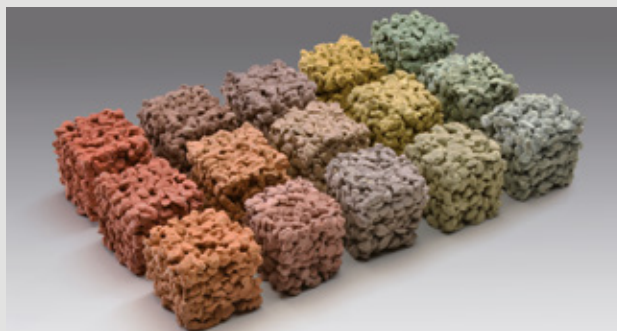
Colorazione con pigmenti