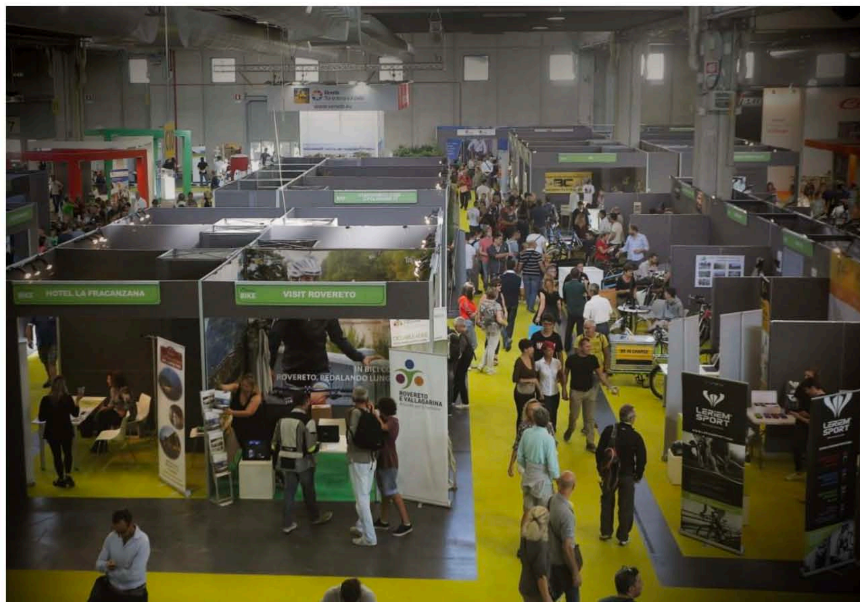
CosmoBikeShow 2016